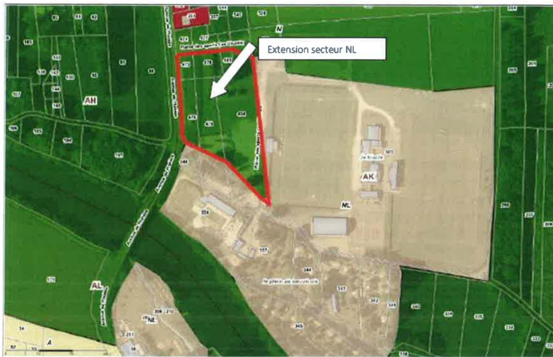
Figure 1. Extrait du plan de zonage NL - Échelle 1/1500ème

Le complexe actuel de sport se trouve à proximité de la rivière Isle, sur sa rive droite : le camping par exemple, se trouve en conséquence concerné ; par une zone humide composée de prairie et de plantations d'arbres spécifiques. Le nouveau secteur proposé à l'extension de la zone NL n'est pas concerné par des caractéristiques de zone humide.